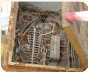
습기에 의한 과도한 부식