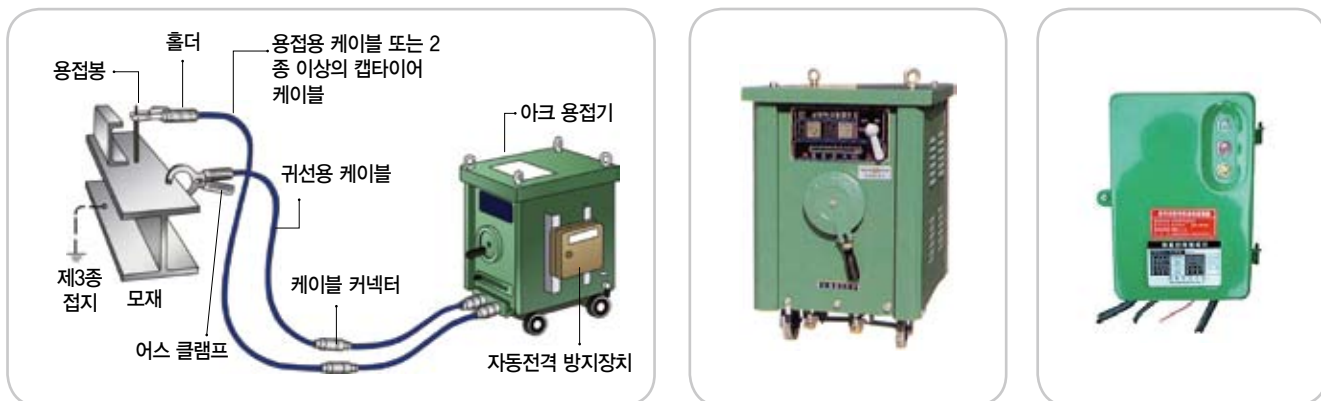
교류아크용접기 및 자동전격방지기